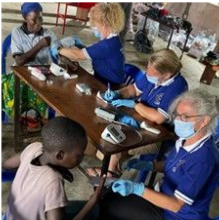
Meten van de bloeddruk en temperatuur