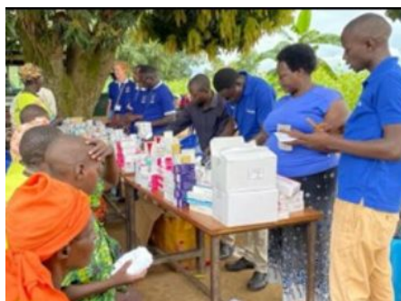
De apotheek onder de mango boom, uitgifte van

Een doodzieke, uitgedroogde, jongen met malaria. Zijn moeder kwam hem brengen nadat ze 10 km hadden moeten lopen. Gelukkig reageerde hij goed op de behandeling en kon hij na een aantal uren weer zitten.